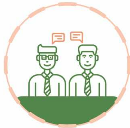
면접유형 = 면접위원 2명 : 지원자 1명