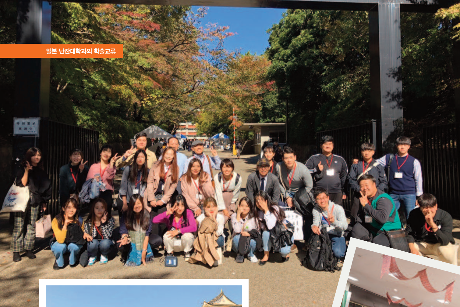
일본 난산대학과의 학술교류